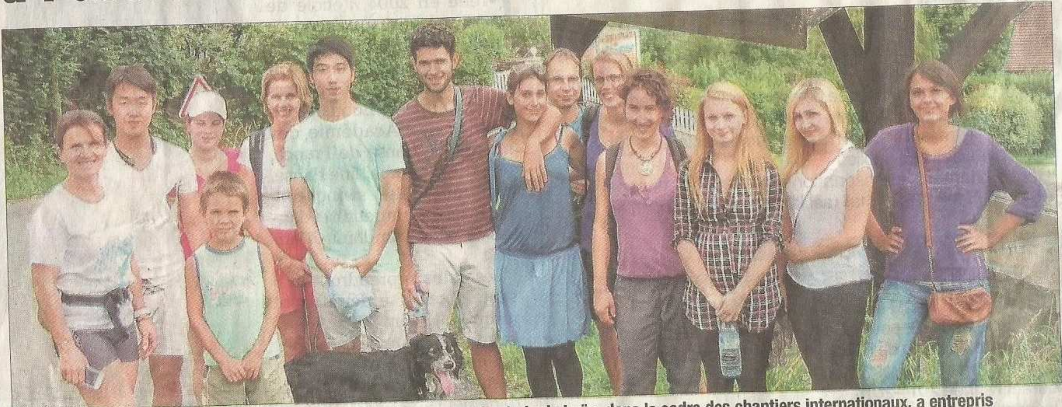
Le groupe de jeunes bénévoles actuellement installé à Bonne, sur le stade de Loëx, dans le cadre des chantiers internationaux, a entrepris mardi l'ascension du Pralère. Le rythme de la grimpe était soutenu mais la récompense au sommet amplement méritée, avec la contemplation de la vallée. Hier après-midi, ces mêmes jeunes proposaient un concours international de pétanque, ouverts à tous, sur le stade de Loëx.