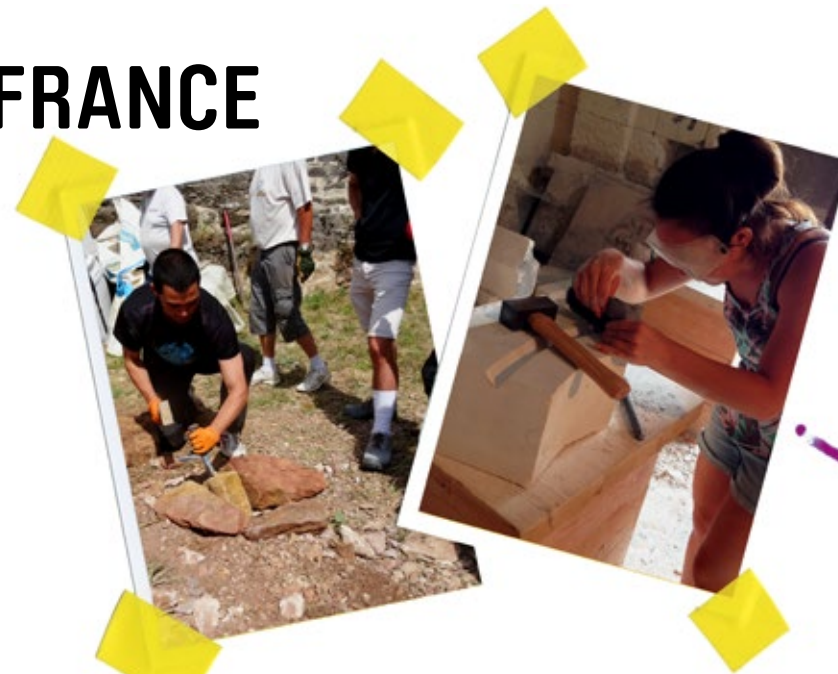
APPRENDRE LA TAILLE DE PIERRE À VIVIERS (ARDÈCHE, AUVERGNE-RHÔNE-ALPES)

Pour la 7 ème année consécutive, la mairie de Viviers et le Centre International Construction et Patrimoine (dit CICP) collaborent avec Jeunesse et Reconstruction pour que des jeunes locaux et étrangers participent ensemble à la réhabilitation du patrimoine local et notamment de l'aile sud de la Maison des Chevaliers. A terme, ce grand projet de réhabilitation patrimoniale permettra l'aménagement et l'ouverture d'un gîte d'étape cycliste pour continuer de valoriser ce monument. La durée de travail quotidien est de 4 à 5 heures, 5j/7. Divers travaux de restauration sont prévus : taille de pierre, maçonnerie et travaux d'aménagement. Pour leurs réalisations, les volontaires sont encadré-e-s par un tailleur de pierre professionnel, un maçon spécialisé dans la restauration du bâti ancien et des bénévoles du CICP. Deux équipes de jeunes issues du territoire participent également aux travaux. Ce chantier donne lieu à des échanges interculturels et intergénérationnels riches.